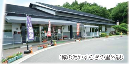
(城の湯やすらぎの里外観)