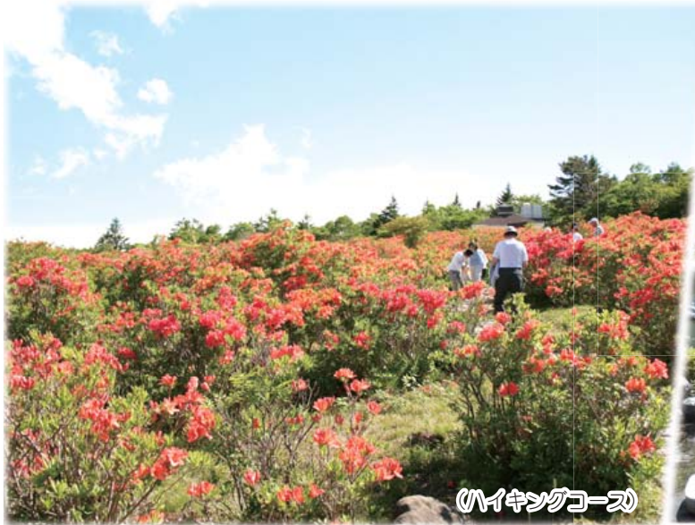
(ハイキングコース)