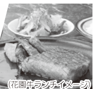
(花園牛ステーキイメージ)