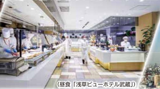
(昼食「浅草ビューホテル武蔵」)