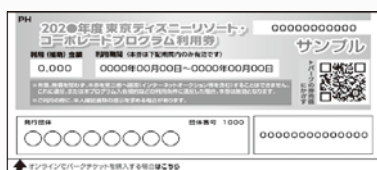
コーポレートプログラム利用券

東京ディズニーランド®/東京ディズニーシー®のパークチケットの購入やディズニーホテル宿泊にご利用いただける利用券です。