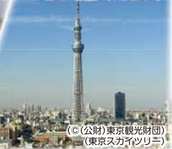
((東京スカイツリー))