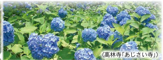
(高林寺「あじさい寺」)