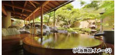
(入浴施設イメージ)